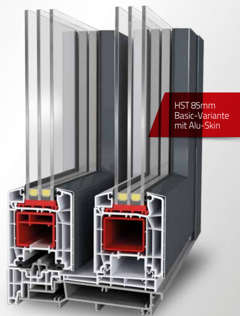
HST 85mm Basic-Variante mit Alu-Skin